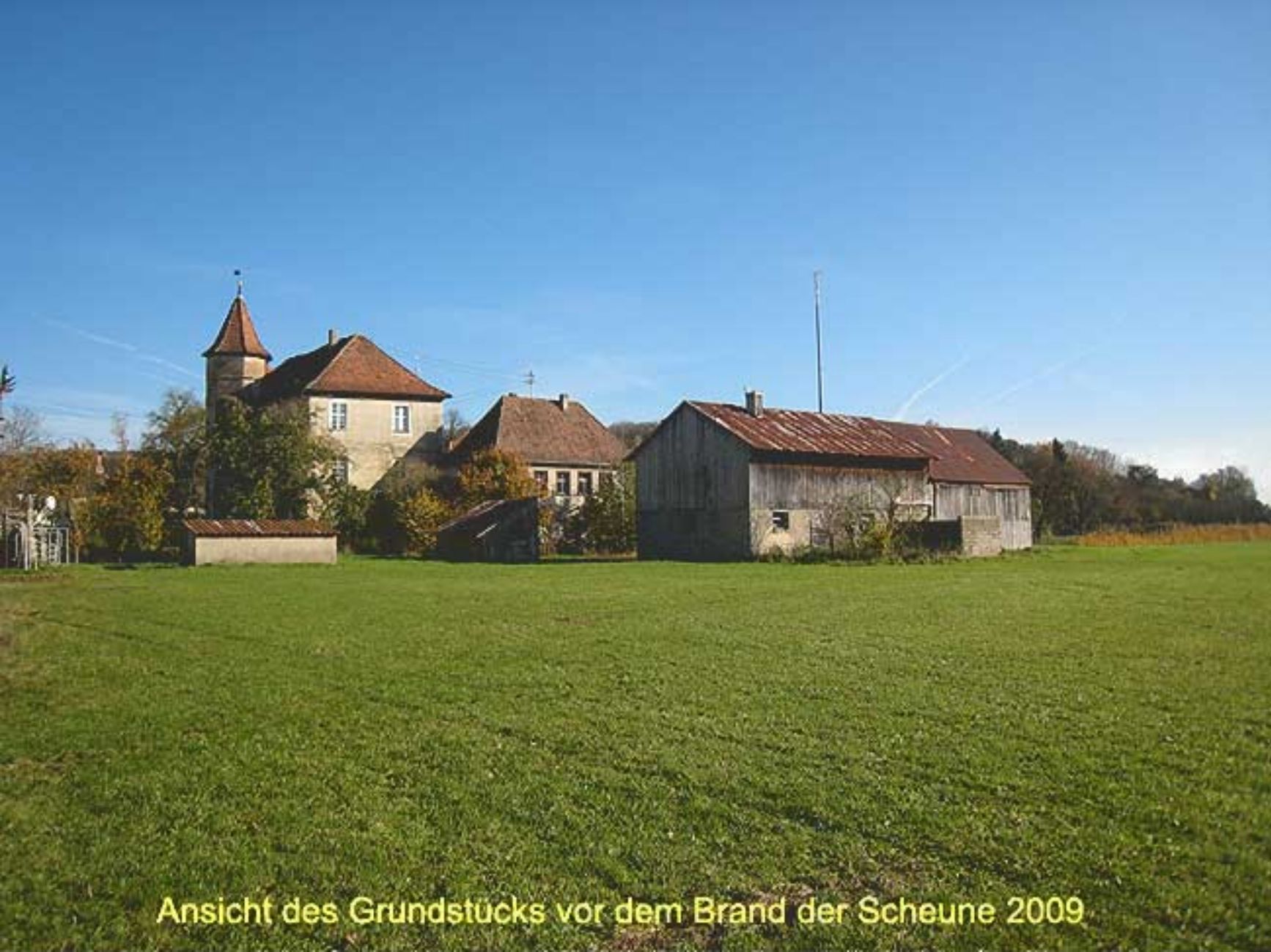
Ansicht des Grundstücks vor dem Brand der Scheune 2009